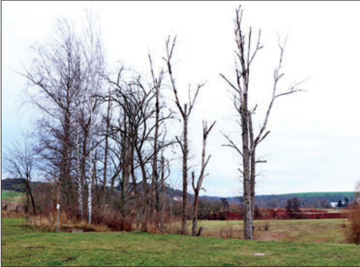
Abgestorbene Bäume am ehemaliger Hartplatz Hochuferstraße. Auf dem früheren Sportgelände soll das Projekt Auenwald realisiert werden.