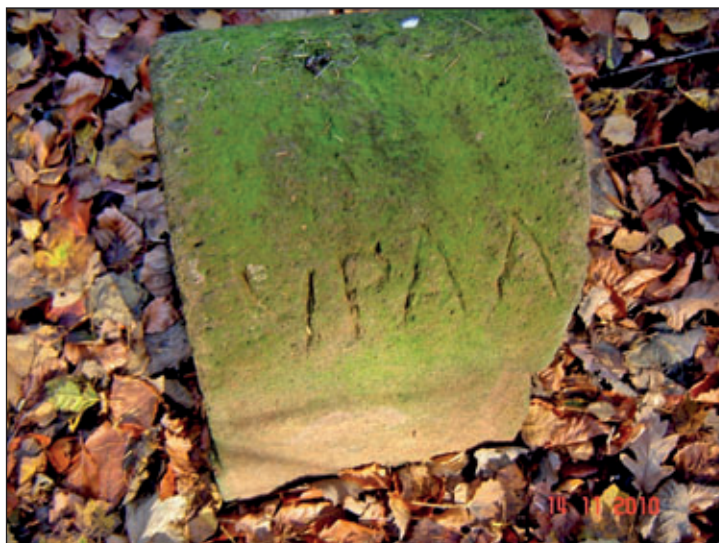
Grenzstein No. 20 mit Jahreszahl 1771 und Reliefschwertern, nahe am Lunzenauer Fahrweg mit nachträglich eingebrachten kyrillischen Buchstaben

Den vollständigen und ungekürzten Beitrag zu den Grenzen des Rochlitzer Waldes und ihre Zeichen mit Quellenangaben und weiteren Bildern und handgezeichneten topografischen Karten von Uhlich einschließlich Bildnachweis können in den "Beiträgen zur Noßwitzer Geschichte" von Dieter Möbius und Wolfgang Richter, Heft 8 im Archiv des RGV, Hochuferstraße 3A eingesehen werden. Das Archiv ist montags und donnerstags von 9.00 Uhr bis 12.00 Uhr und nach Vereinbarung geöffnet. Termine können unter 01525 7518722 mit Frau Anker vereinbart werden.