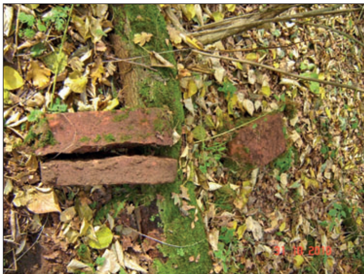
Grenzstein No. 4 auf Carsdorfer Seite, zerbrochen durch Umwelteinflüsse