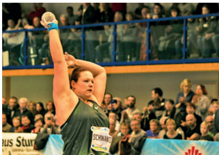
Christina Schwanitz