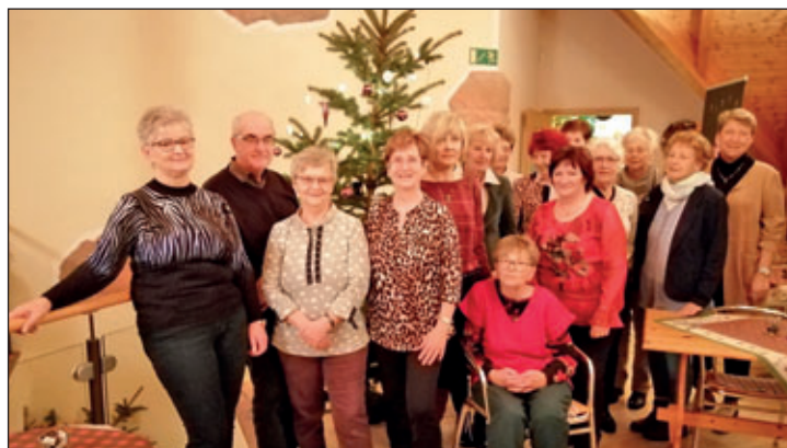
2019 Weihnachtsfeier auf dem Berg