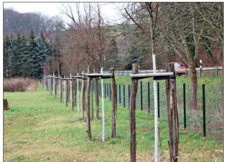
Aufforstungsareal ehemalige Kunststofftechnik Waldheimer Straße