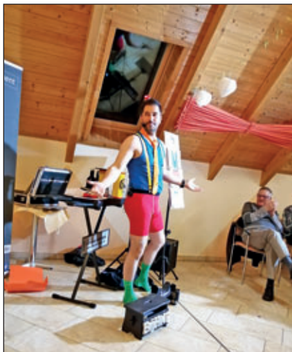
Der Illusionist am Ende der Show

Am Dienstag, dem 17. Dezember 2019 trafen sich die TänzerInnen der Rochlitzer Line dancer nicht zur gewohnten Zeit in der Turnhalle der Oberschule „An der Mulde“, sondern auf dem neu gestalteten Parkplatz am Rochlitzer Berg.