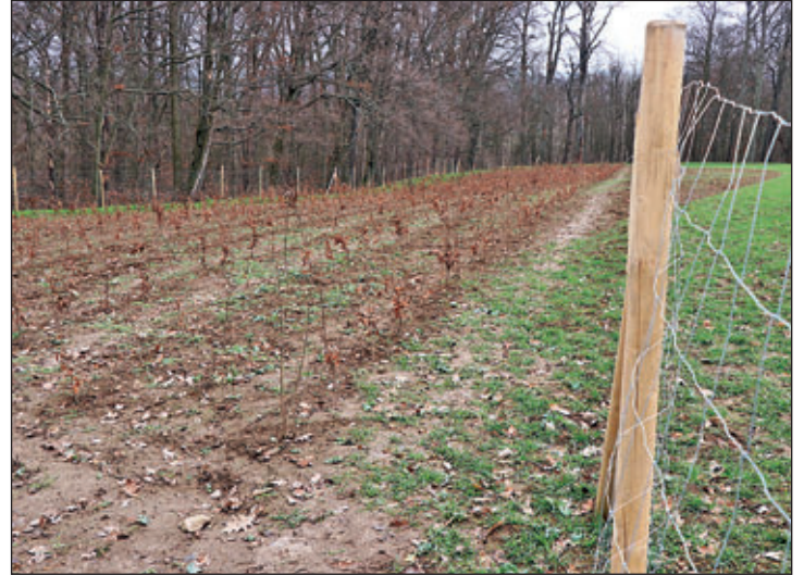
Städtische Aufforstungsfläche (2000 qm) am Abzweig Sörnzig