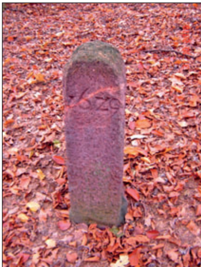
Grenzstein No. 14 auf Carsdorfer Seite, noch gut erhalten

Es gab aber noch Grenzsteine in gutem Zustand. Zum Beispiel Grenzstein No. 14 auf Carsdorfer Seite, der die Jahreszahl 1629 trägt. Er hat sich für sein Alter, fast 400 Jahre, gut gehalten. Der Grenzstein No. 20 mit der Jahreszahl 1771, nahe am Lunzenauer Fahrweg auf Sörnziger Seite, hat Reliefschwerter und wurde nachträglich mit kyrillischen Buchstaben „verzieren“. Es müssen wohl im Jahre 1945, dort in der Senke, wo der Stein steht, Soldaten der Roten Armee gelagert haben. In den Stein wurde das Wort „URAL“ tief eingeritzt.