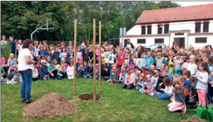
Baumpflanzung im Rahmen des MORO-Projektes an der Regenbogen-Grundschule