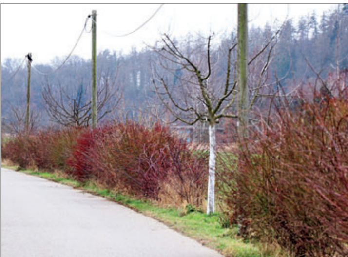
Neuanlage von Büschen und Bäumen als Begleitgrün am Radweg Rochlitz-Steedten