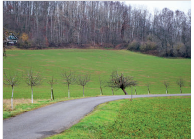
Von der Initiative für ein grünes Rochlitz vorgenommene Baum-Neuanpflanzungen an der Zaßnitzer Straße.